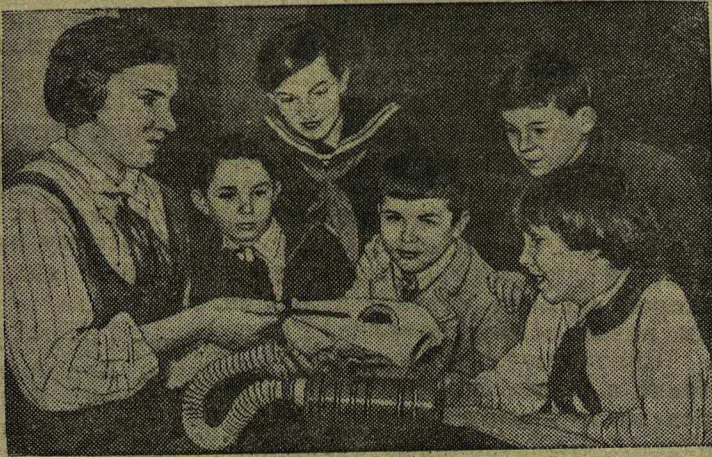
Отличники ученики старших классов 2-й средней школы г. Щекино (Тульская область), сдавшие нормы ПВХО, руководят кружками ПВХО в младших классах.

бригадами, для проведения там массовой работы среди колхозников по реализации 14-й лотереи.