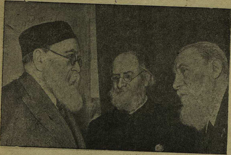
На снимке (слева направо): академики А. Е. Фаворский, А. Н. Крылов и А. Н. Бах.

В Доме ученых (Москва) состоялось чествование академика А. Е. Фаворского в связи с 80-летием со дня его рождения и 55-летием научно-педагогической деятельности.